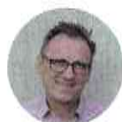
DR. KRIZSAI JÁNOS

2024. 10. 11. - 2027. 10. 11. megbízatással