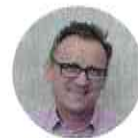
DR. KRIZSAI JÁNOS

2024. 10. 11. - 2027. 10. 11. megbízatással